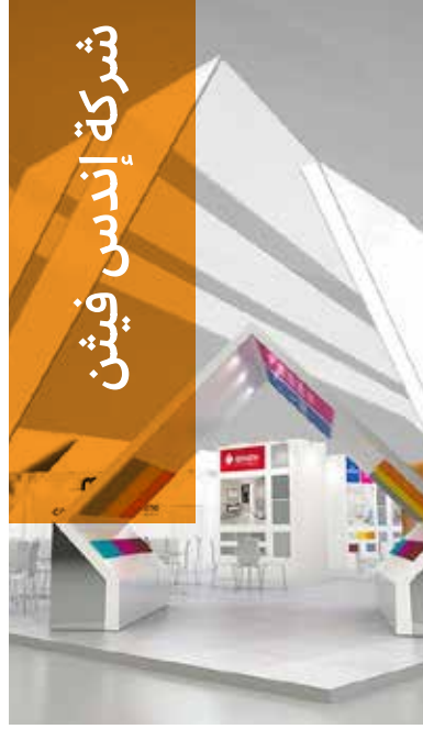
شركة إندس فيشن