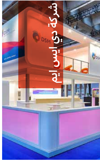
شركة دي ايس ايم